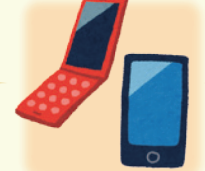
【携帯電話・スマホ】