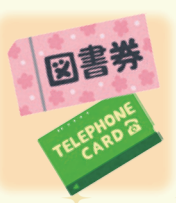
【図書券・テレカ・金券】