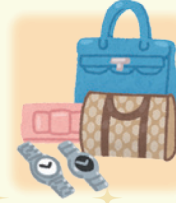
【ブランド品・時計】